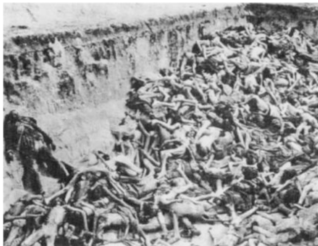
Tífuszban meghalt foglyok Belsenben