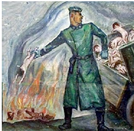
Nem volt nehéz illusztrációt készíteni ehhez a hazugsághoz, és indulhatott a propagandagépezet

„Nem messze tőlünk lángok csaptak fel egy gödörből, óriási lángok. Valamit égettek ott. Egy teherautó gördült oda a gödörhöz, és beleürítette a terhét. Kisgyerekek voltak. Csecsemők! Igen, én láttam ezt a saját szememmel... Gyerekek a lángokban. (Olyan furcsa-e, hogy az álom azóta elkerüli a szememet?) Odamentünk tehát. Kissé távolabb volt egy másik, nagyobb gödör felnőttek számára...”