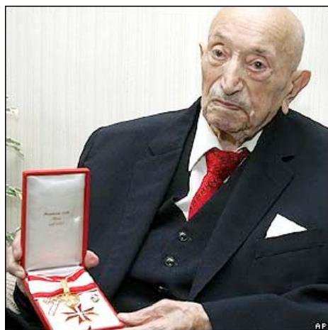
Kitüntetés is kapott - tehát 29 millió volt

Simon Vízestál: „A gyilkosok közöttünk járnak” (Bukarest 1970, Politikai Könyvkiadó) című könyvének 361. oldalán a 3. bekezdésben szól egy dokumentumról, amelyet a treblinkai koncentrációs tábor vezetősége küldött a zsidóktól elrabolt tárgyak listájáról, (1941. október 1. és 1942. augusztus 2. közötti időszak vonatkozásában) a berlini RSHA-nak.