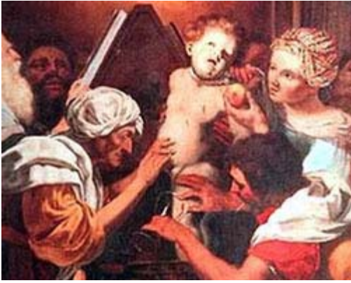
Il martirio del beato Simone da Trento (1472 - Pasqua del 1475) in una rappresentazione dell'epoca

Premessa - L'interessante e documentato articolo di Domenico Savino, pubblicato su queste pagine il 7/2/2006 («Polonia, frankisti e omicidi rituali: il figlio del rabbino conferma...») (1), reca un'impresione che mi sento in dovere di rettificare, laddove afferma che « tutti hanno concordato nel ritenere calunniosa quest'accusa », quella, cioè, dell'omicidio rituale giudaico.