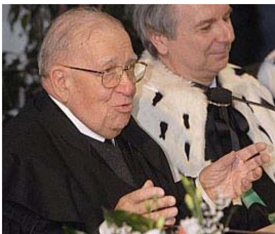
Monsignor Iginio Rogger

A smentire tanta granitica certezza starebbe però ora l'indagine storica di Toaff: «Le deposizioni degli imputati ai processi di Trento concordavano sul fatto che l'infanticidio di Simone sarebbe avvenuto di venerdì nei locali della sinagoga, posta nell'abitazione di Samuele da Norimberga, e più precisamente nell'anticamera della sala dove si raccoglievano gli uomini in preghiera. Questo ambiente, separato dalla sinagoga vera e propria da una porta, era destinato in mancanza di un matroneo alle orazioni delle donne. La porta comunque rimaneva aperta e, durante la liturgia del Sabato, le donne vi facevano capolino quando i rotoli della Torah venivano sollevati ed esibiti da chi officiava sull'almemor, prima della lettura del brano settimanale del Pentateuco. (...) La crocifissione di Simone sarebbe stata effettuata su un banco posto proprio nella cosiddetta 'sinagoga delle donne'. Il corpo del putto, ormai senza vita, sarebbe stato poi trasferito per le funzioni del Sabato nella sala centrale della sinagoga e deposto sull'almemor».