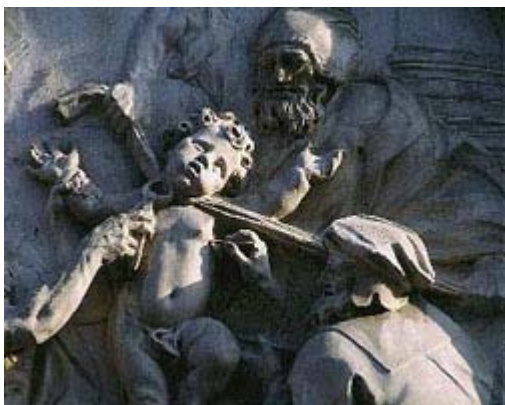
Il Rilievo di Francesco Orlandini , il martirio di San Simonino sulle porte del palazzo Salvadori a Trento

C'è davvero lo zampino della setta frankista nello scandalo che ha travolto l'episcopato polacco, monsignor Wielgus e i suoi trascorsi di informatore della polizia politica comunista, come suggerisce Maurizio Blondet nel suo articolo al riguardo? (1)