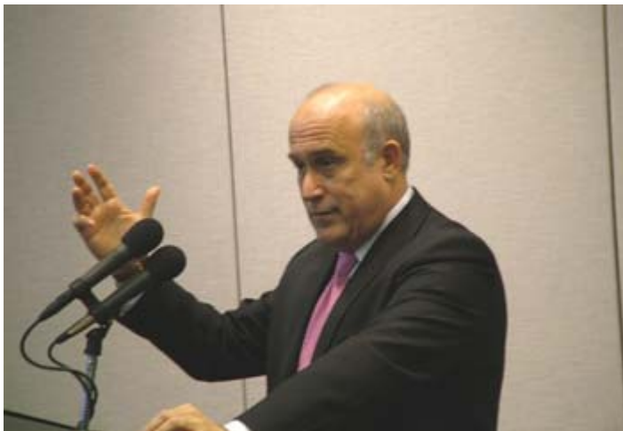
L'ambasciatore israeliano Oded Ben Hur

« Il caso per noi è chiuso », commenta compiaciuto l'ambasciatore Ben Hur.