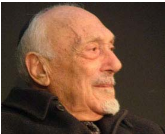
L'ex rabbino capo di Roma Elio Toaff

qualche anno fa da Diego Quaglioni ed Anna Esposito. L'assunto da cui Toaff parte è che le deposizioni degli ebrei sotto processo a Trento siano generalmente veritiere, e questo per la sola ragione che sarebbero troppo concordanti e troppo particolareggiate per essere una pura invenzione dei giudici. Le stesse notazioni potrebbero provare l'opposto, come dimostrano molti processi, non ultimi quelli di stregoneria, in cui le donne sotto processo, richieste (sotto tortura, non importa quanto regolamentata) di denunciare i complici, si diffondono minuziosamente su eventi e narrazioni che sembrano appartenere al loro mondo, non a quello degli inquisitori. Ne dobbiamo dedurre che andare al sabba era una pratica femminile comune tra Trecento e Settecento?». (9)