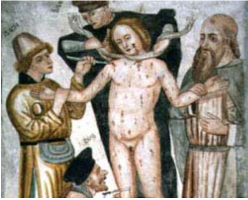
Raffigurazione del sacrificio di san Simonino ad opera degli ebrei di Trento